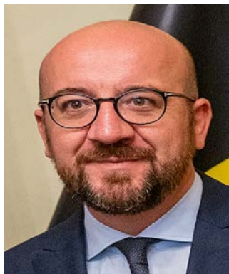
นาย Charles Michel