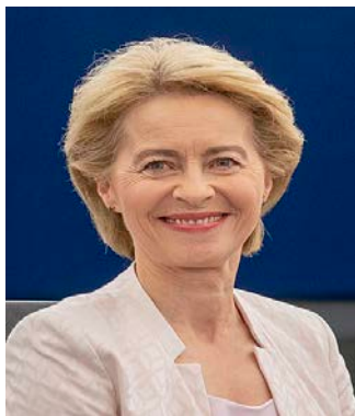
นาง Ursula von der Leyen