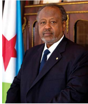
นาย Ismail Omar Guelleh