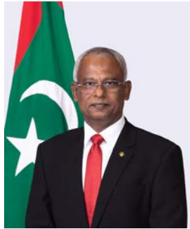
นายอิบราฮิม โมฮาเหม็ด โซลิห์ (Ibrahim Mohamed Solih)