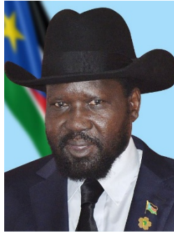
Salva Kiir Mayardit