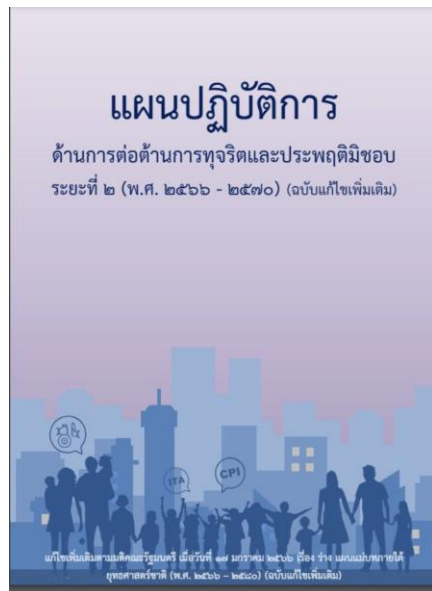
แผนปฏิบัติการด้านการต่อต้านการทุจริตและประพฤติมิชอบ ระยะที่ 2 (พ.ศ.2566-2570)