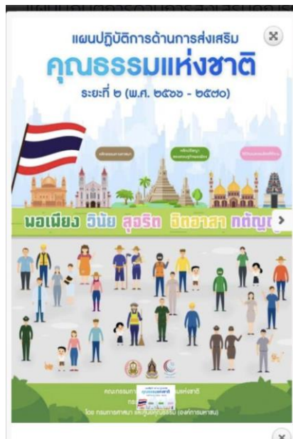
แผนปฏิบัติการด้านการส่งเสริมคุณธรรมแห่งชาติ ระยะที่ 2 (พ.ศ.2566-2570)