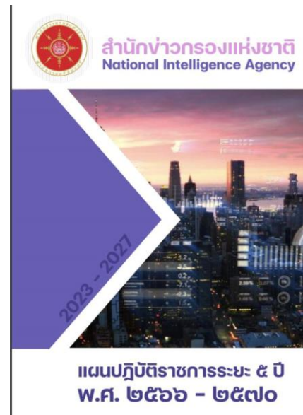
แผนปฏิบัติราชการระยะ 5 ปี พ.ศ. ๒๕๖๖ - ๒๕๗๐