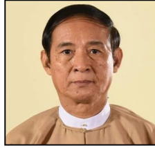
อุวินมึ้น (U Win Myint)