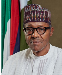
พล.ต. มุฮัมมาดู บูฮารี (Muhammadu Buhari)