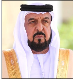
เชค เคาะลีฟะฮ์ บิน ซายิด อาลนะห์ยาน (His Highness Sheikh Khalifa bin Zayed Al Nahyan)