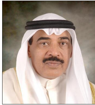
เชค เศาะบะห์ อัลคอลลิด อัลฮะมัด อาลเศาะบะห์ (Sheikh Sabah al-Khaled al-Hamad Al-Sabah)