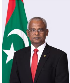
นายอิบราฮิม โมฮาเหม็ด โซลีห์ (Ibrahim Mohamed Solih)