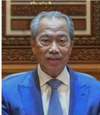
ตัน ศรี มุห์ยิดดิน ยัสซิน (TAN SRI MUHYIDDIN YASSIN)

ตำแหน่ง - นายกรัฐมนตรีคนที่ 8 - ประธานพรรคเบอร์ซาตู