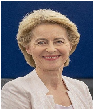
นาง Ursula von der Leyen