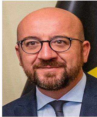
นาย Charles Michel